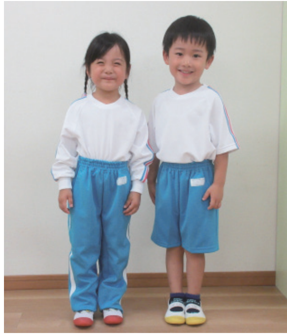
※体操服の冬服と夏服です。