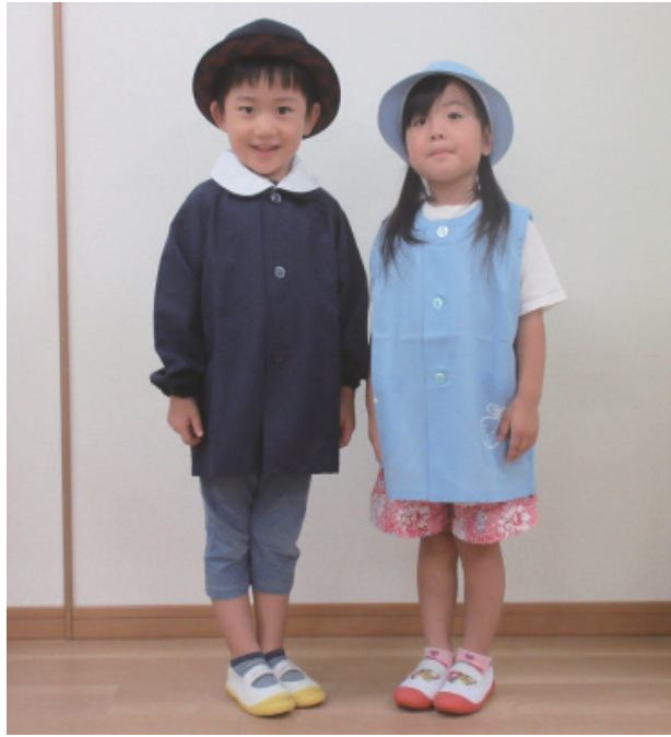
※制服の冬服と夏服です。